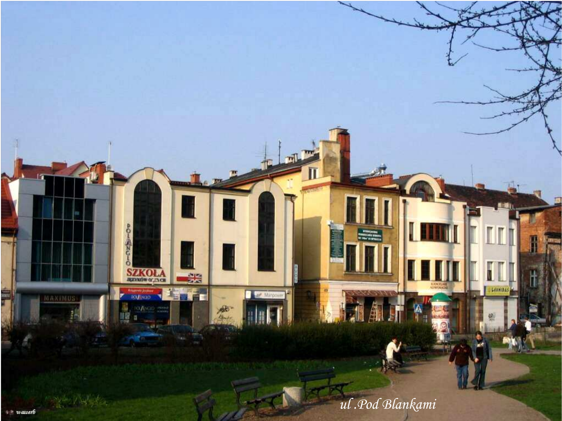
ul. Pod Blankami