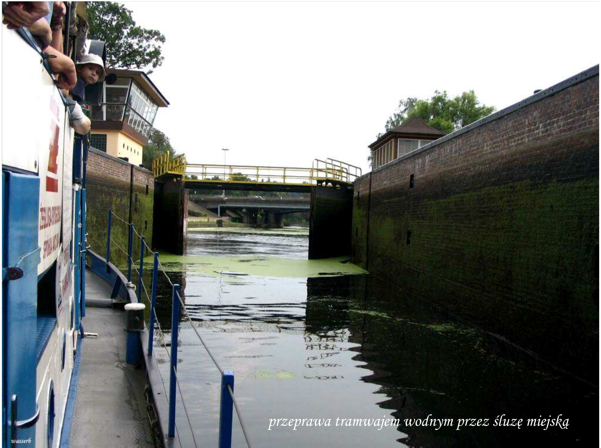
przeprawa tramwajem wodnym przez śluzę miejską