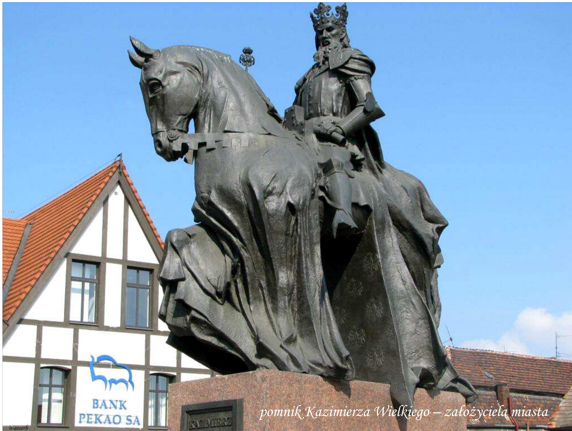
pomnik Kazimierza Wielkiego – założyciela miasta