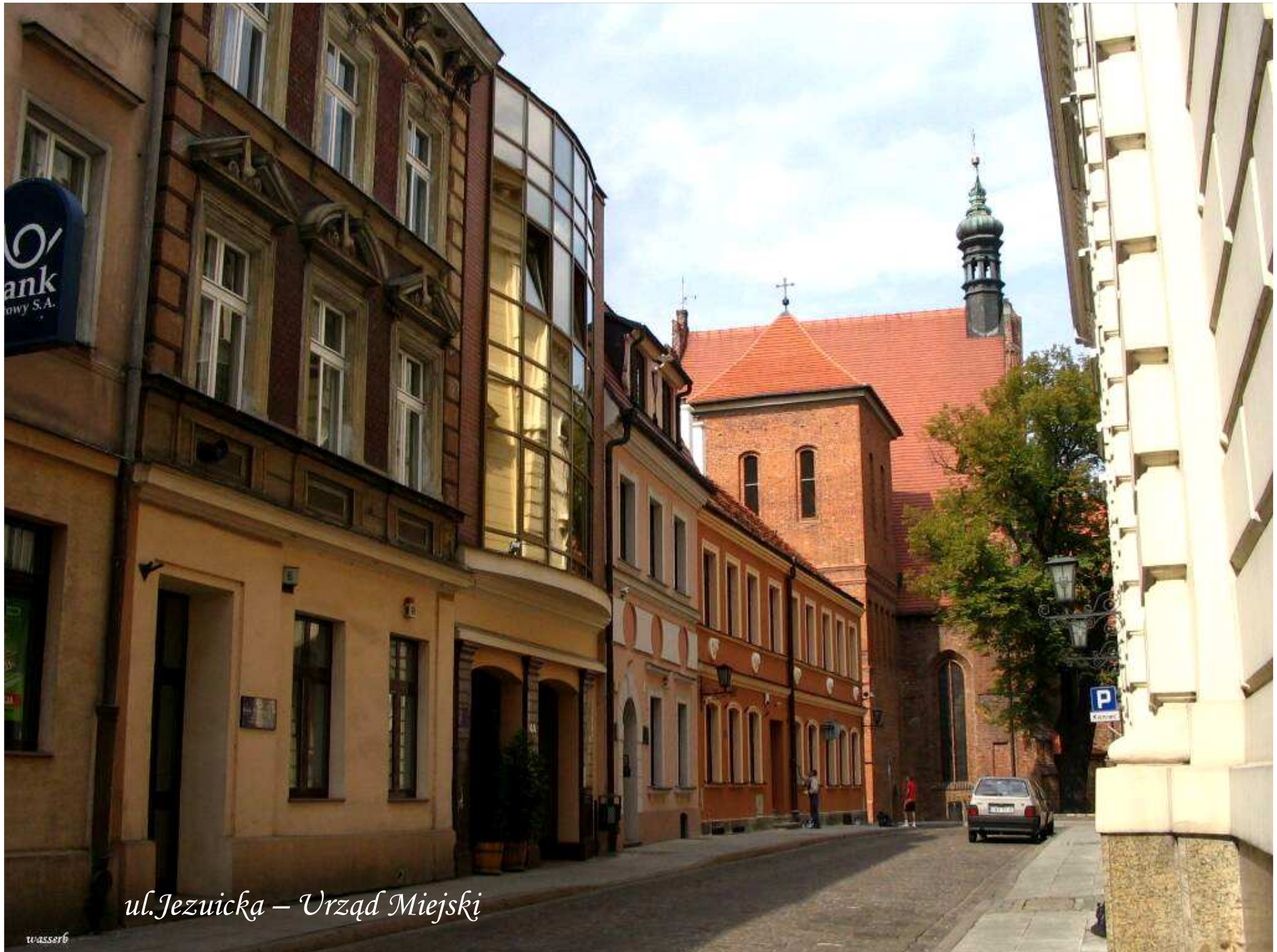
ul. Jezuicka – Urząd Miejski