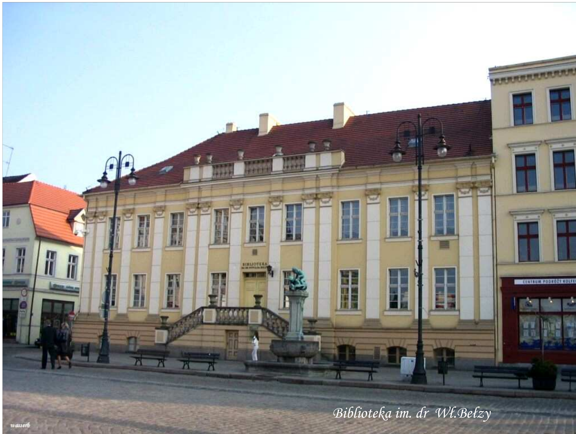
Biblioteka im. dr Wł. Bełzy