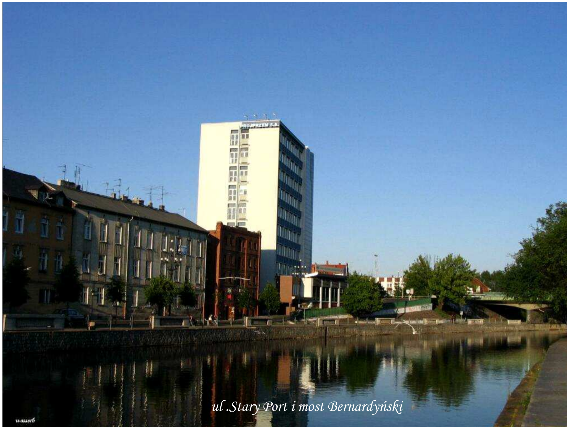
ul. Stary Port i most Bernardyński