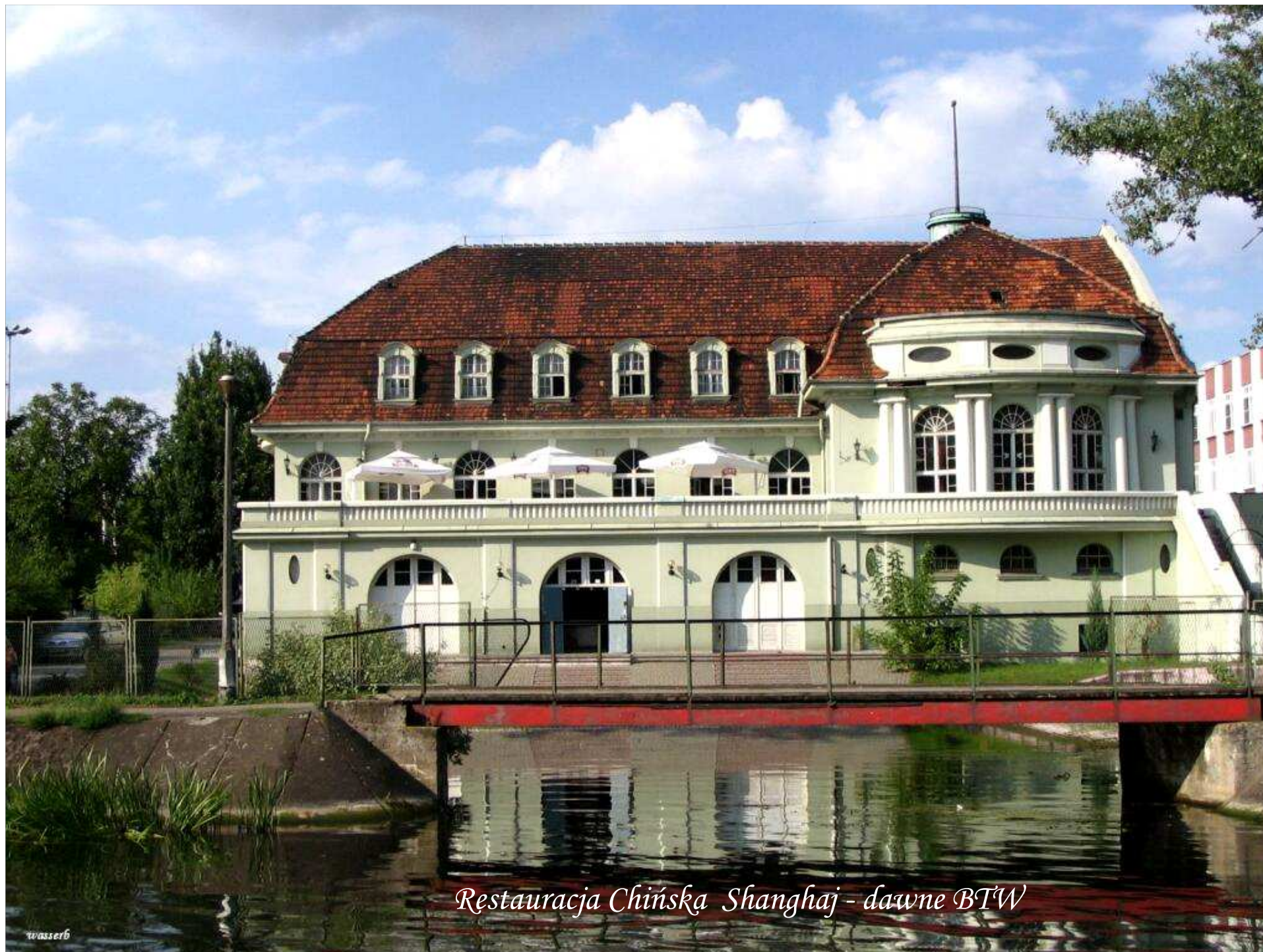
Restauracja Chińska Shanghai - dawne BTW