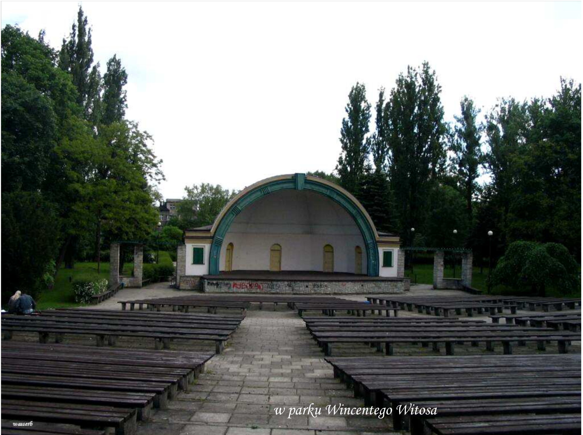
w parku Wincentego Witosa