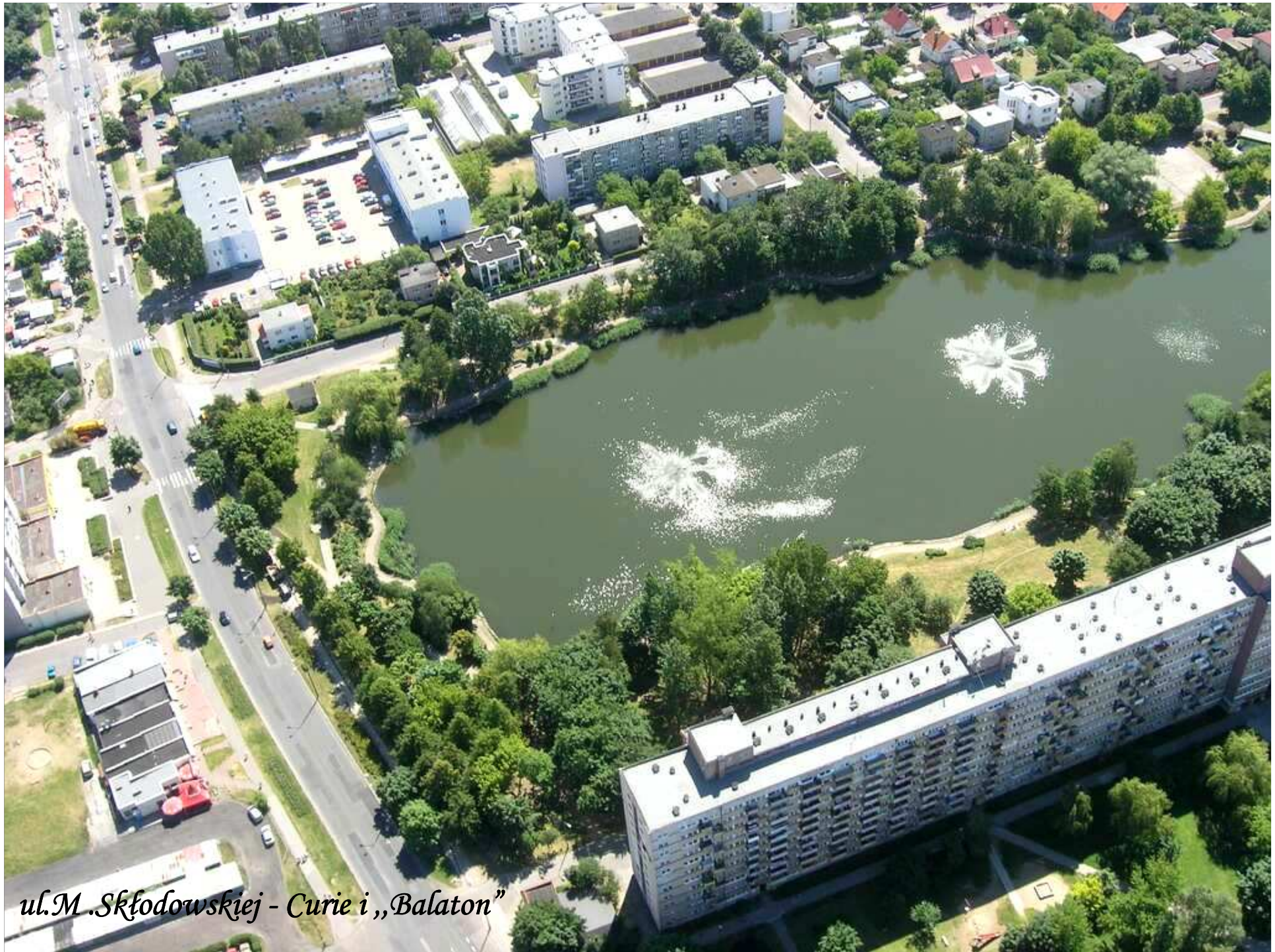
ul. M. Skłodowskiej - Curie i „Balaton”