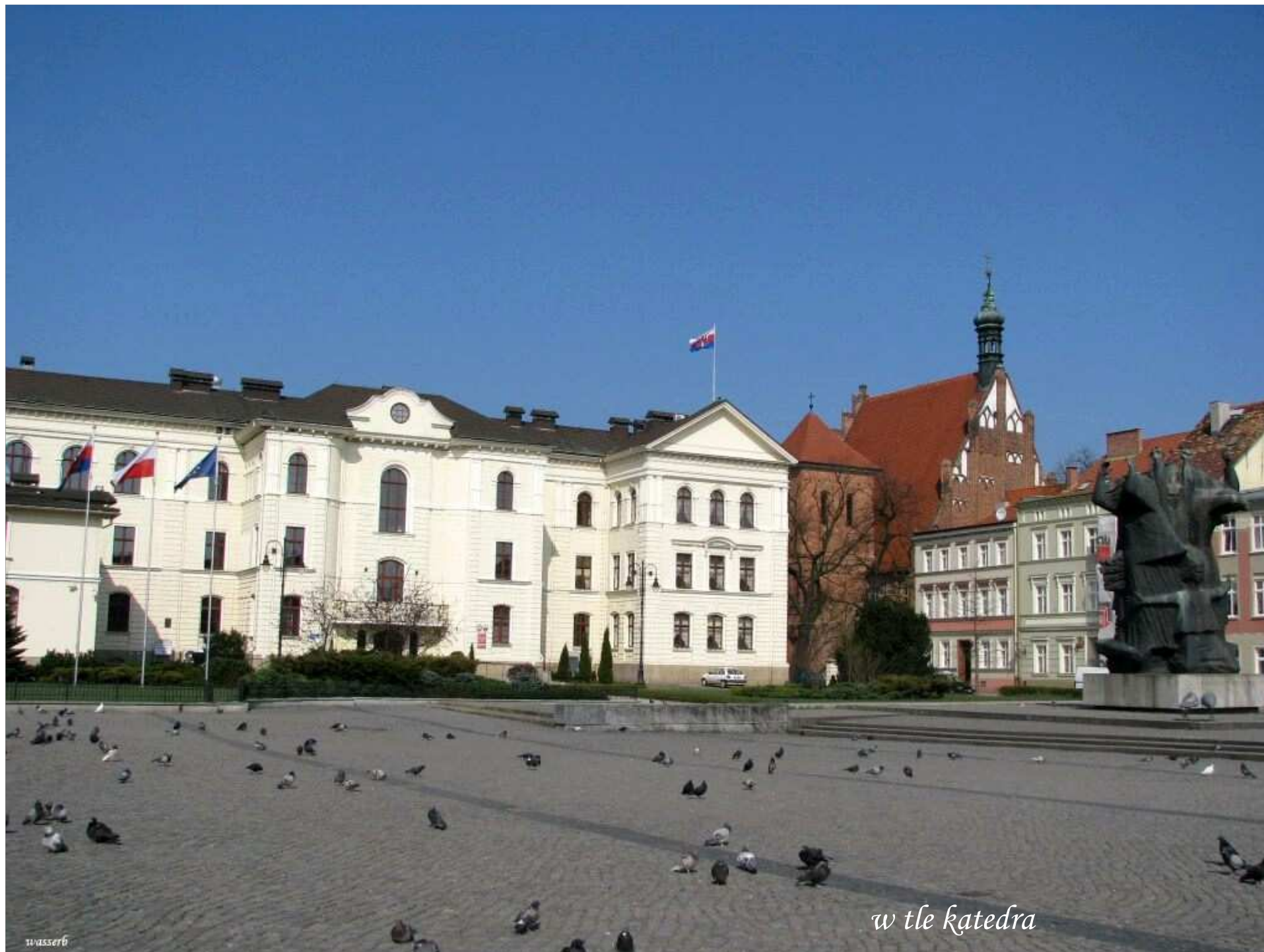
w tle katedra