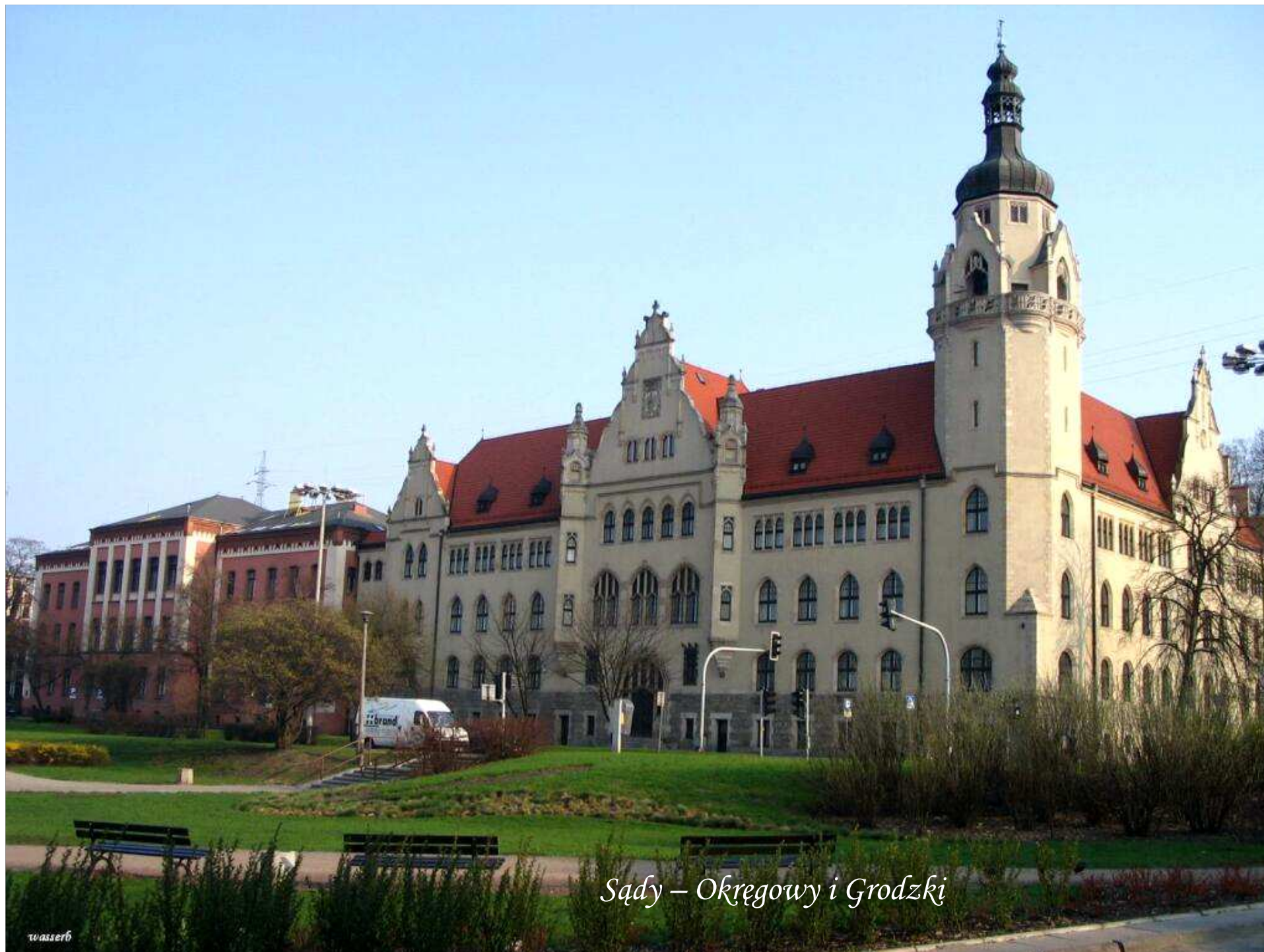
Sądy – Okręgowy i Grodzki