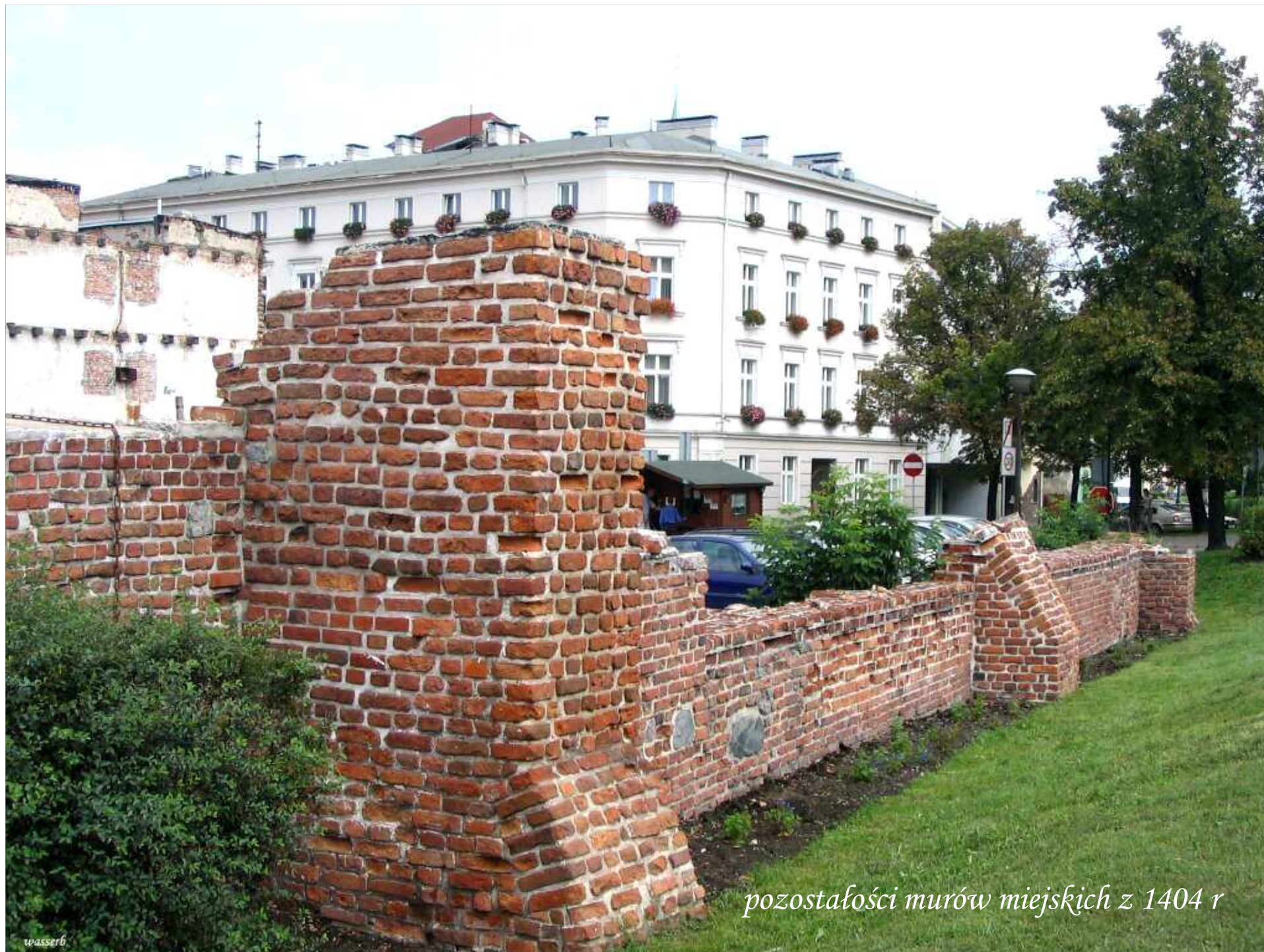
pozostałości murów miejskich z 1404 r