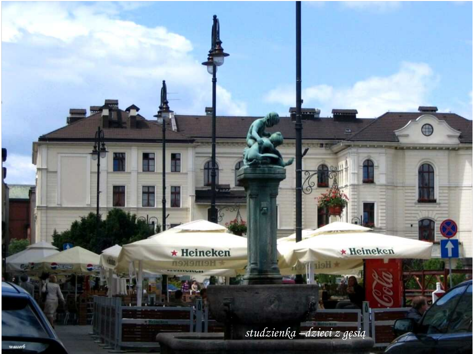
studzienka – dzieci z gęsią