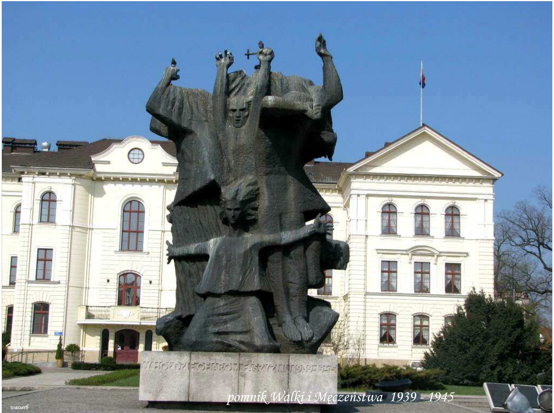
pomnik Walki i Męczeństwa 1939 - 1945