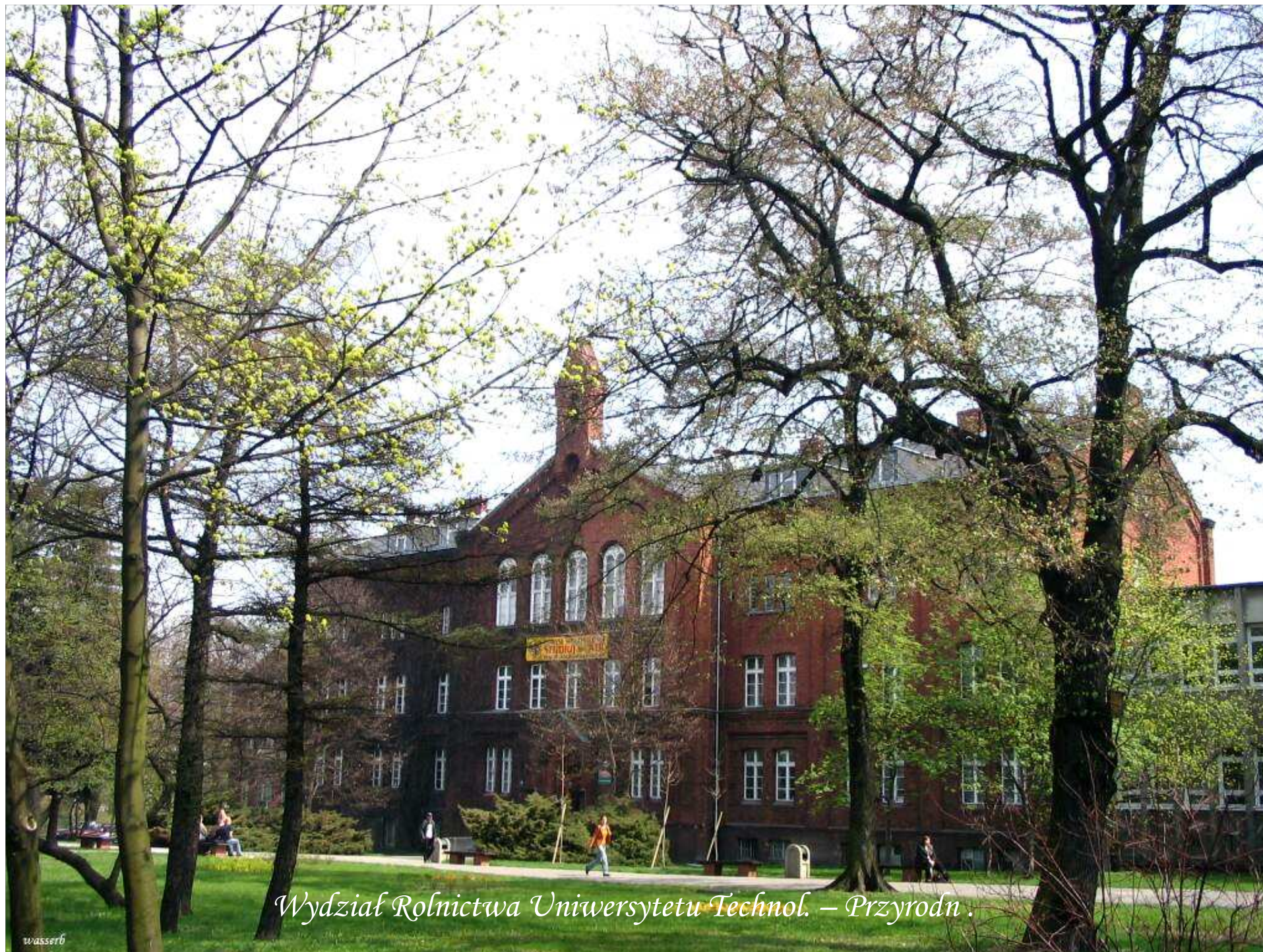
Wydział Rolnictwa Uniwersytetu Technol. – Przyrodn.