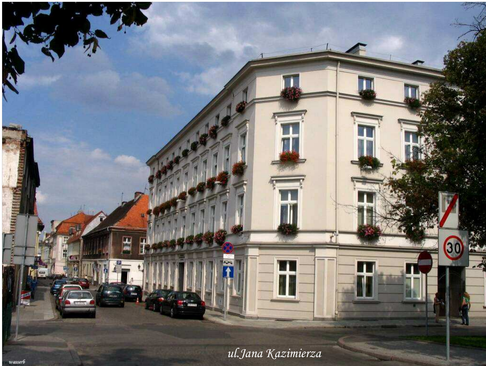
ul. Jana Kazimierza