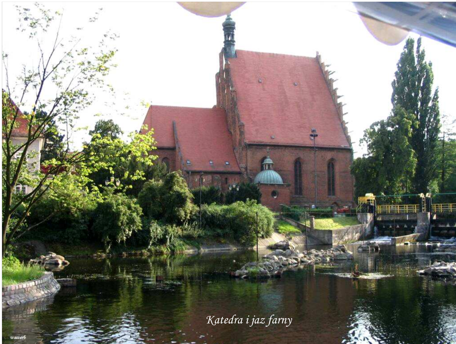
Katedra i jaz farny