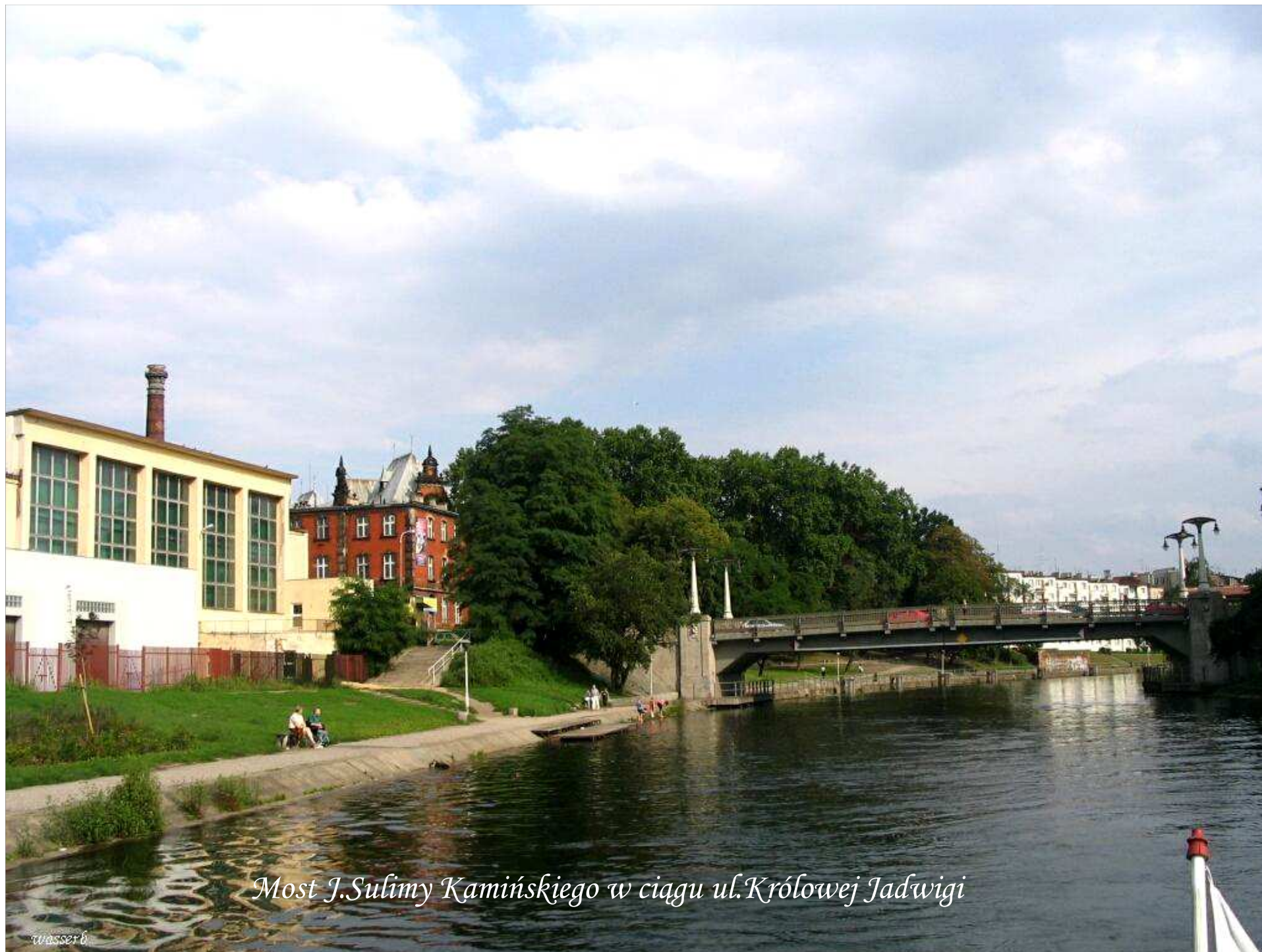
Most J. Sulimy Kamińskiego w ciągu ul. Królowej Jadwigi