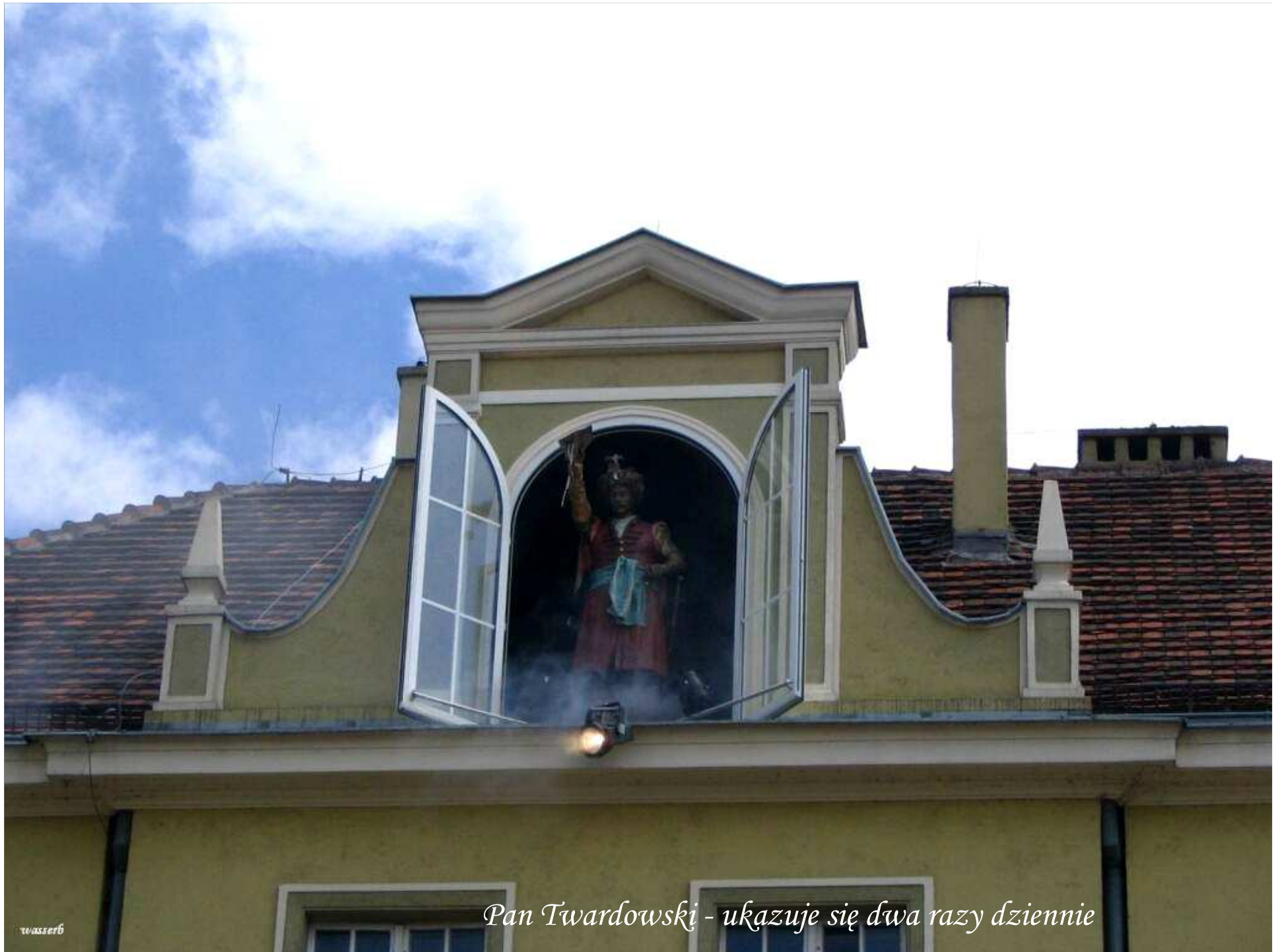
Pan Twardowski - ukazuje się dwa razy dziennie