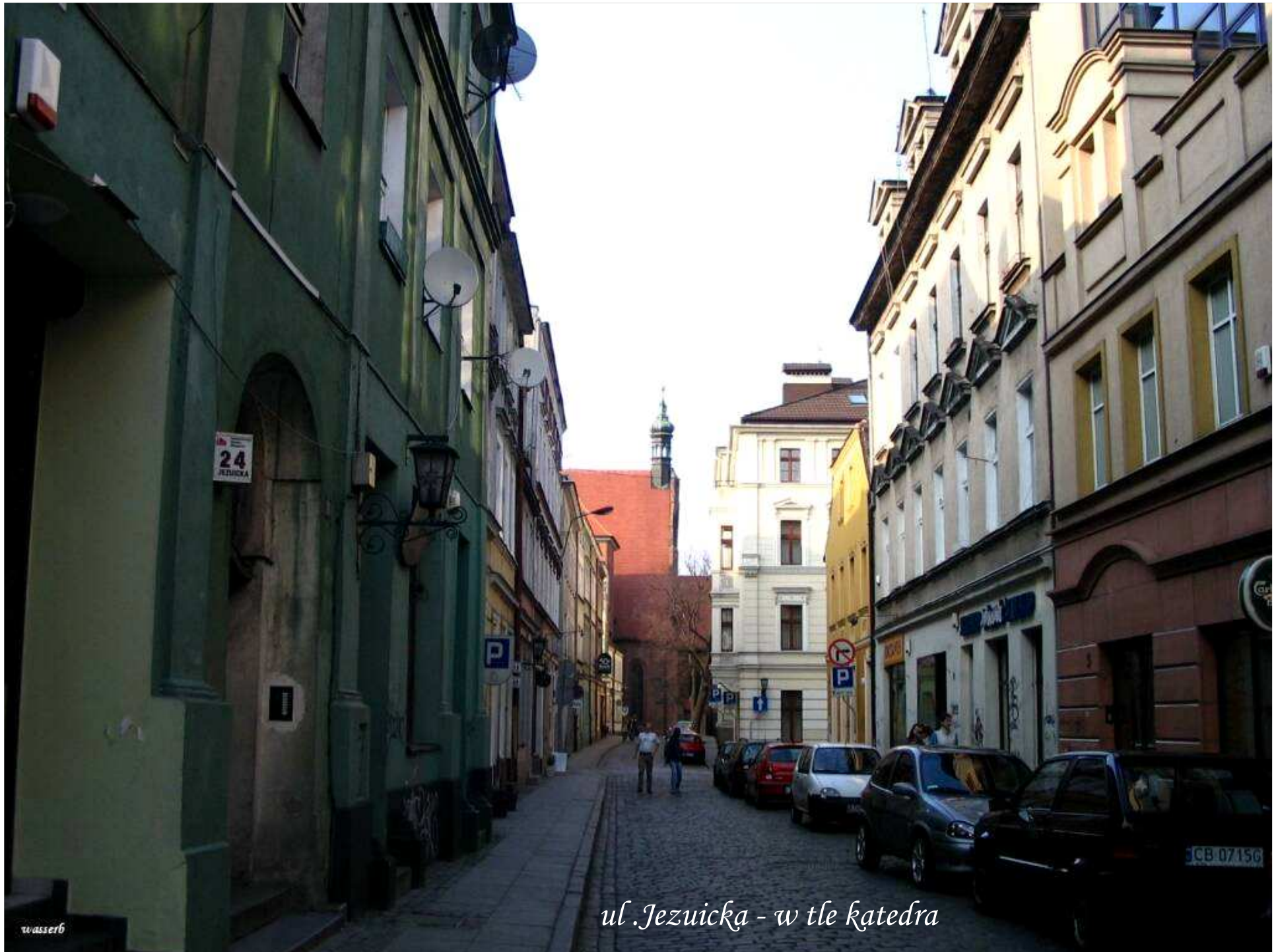
ul. Jezuicka - w tle katedra