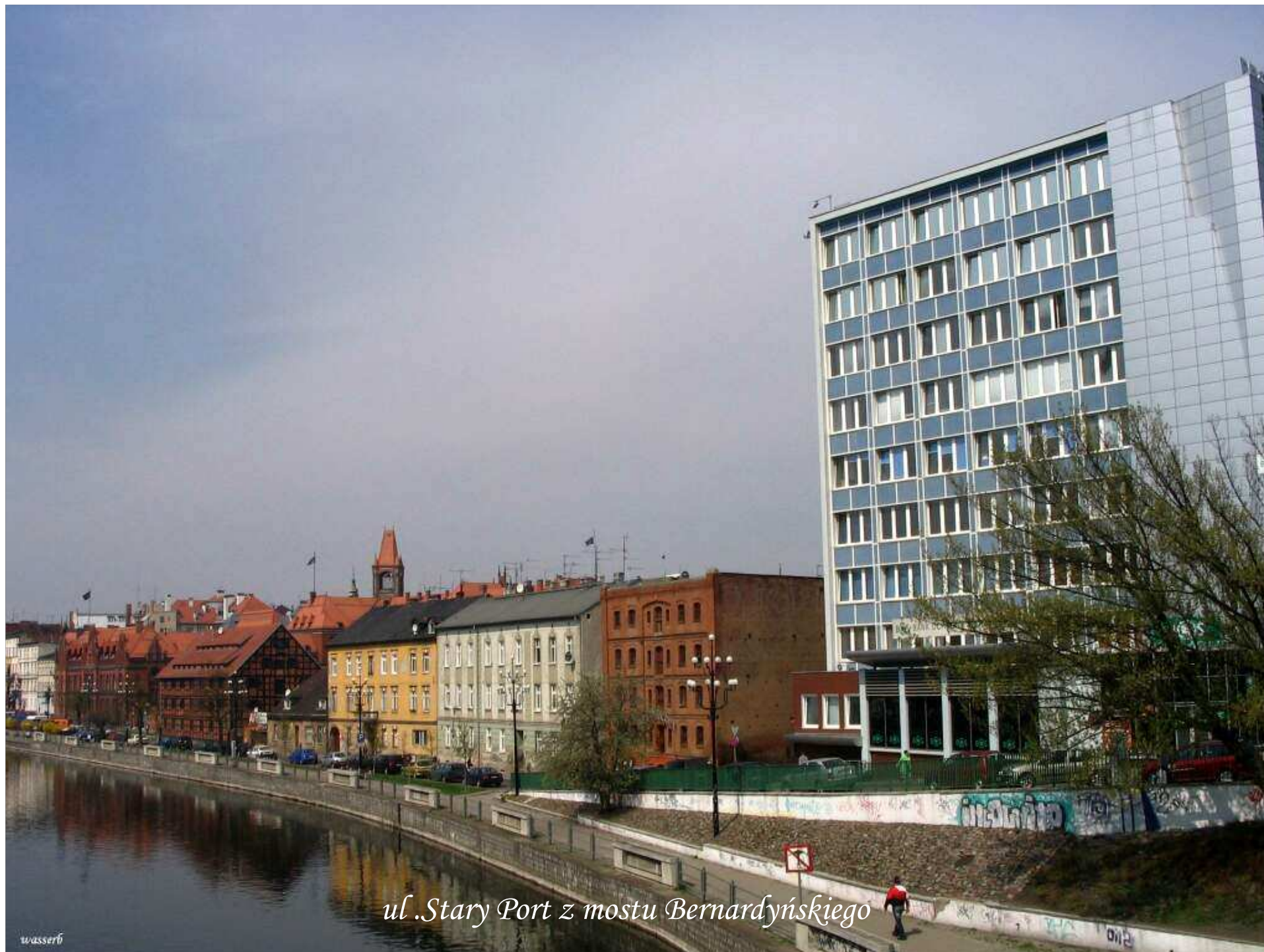
ul. Stary Port z mostu Bernardyńskiego