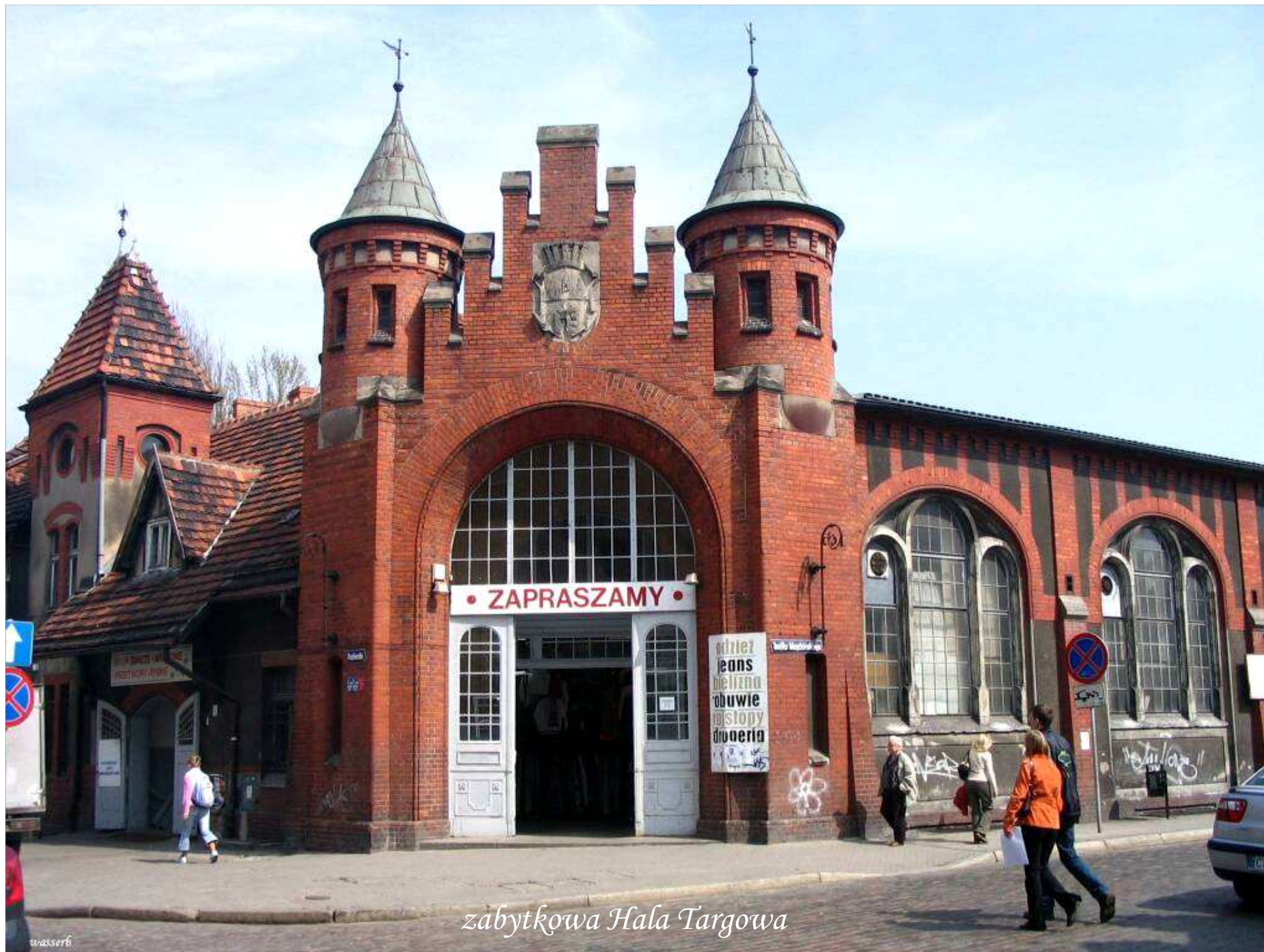
zabytkowa Hala Targowa