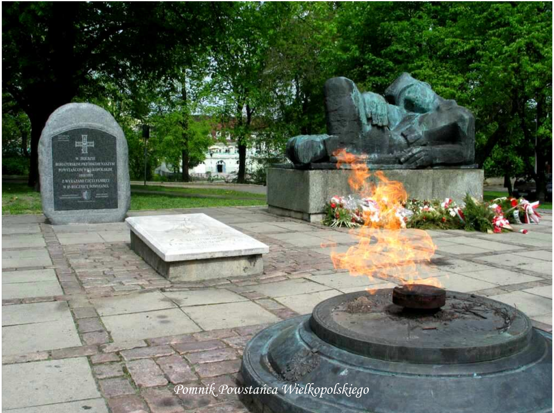
Pomnik Powstańca Wielkopolskiego