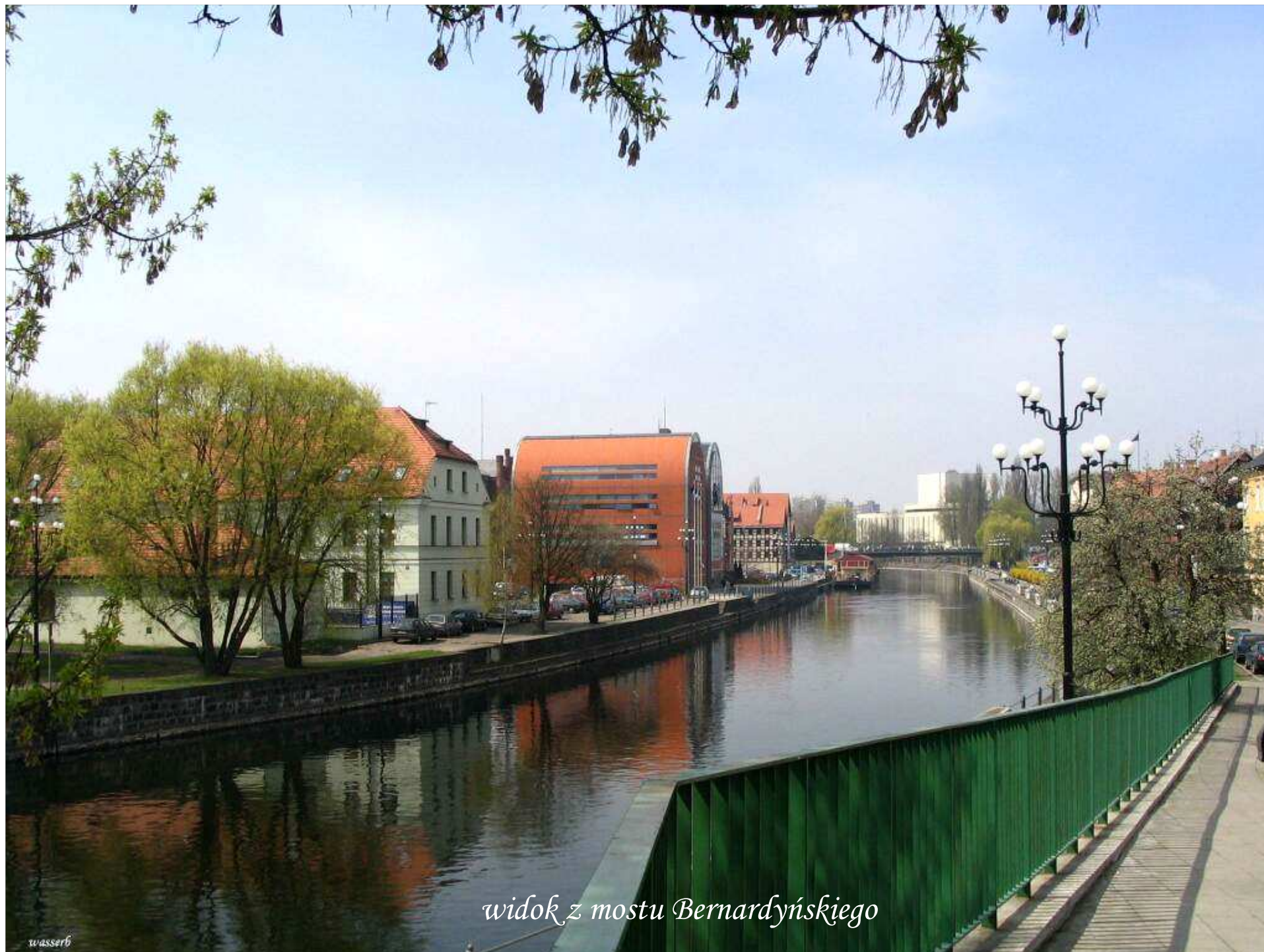
widok z mostu Bernardyńskiego